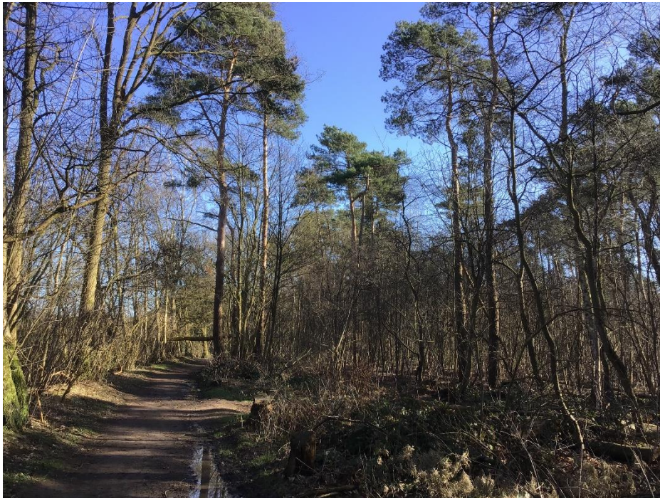
Waldweg im Süden am Rande des Plangebiets.