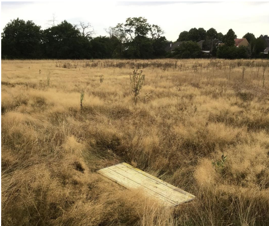
Ausbringen von Reptilienbrettern für die Thermoregulation der Eidechsen in Waldrandnähe auf der Fläche des aufgegebenen Sportplatzes.