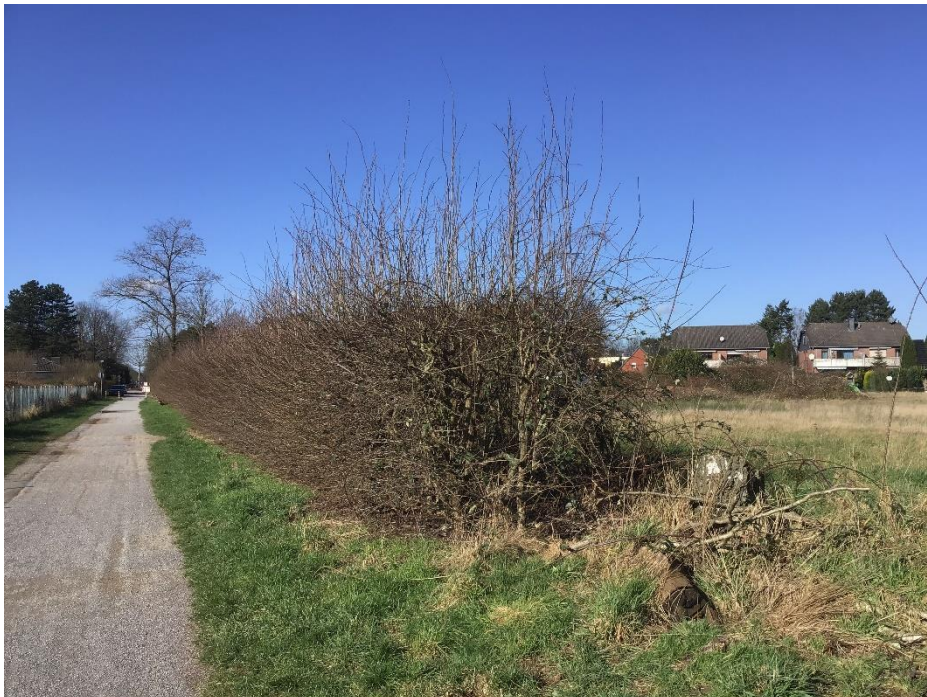
Weißdornhecke im Südwesten des Plangebiets, welche zu einer Leitstruktur entwickelt werden sollte.