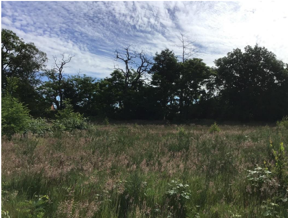
Blick von dem aufgegebenen Sportplatz auf die Gehölzreihe im Plangebiet.