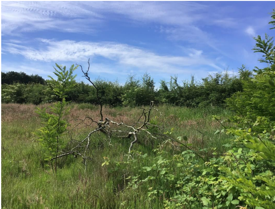
Die Weißdornhecke im Sommer, betrachtet vom Plangebiet aus.