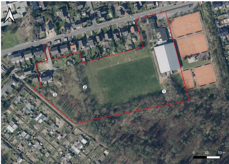
Abb. 2 Standorte der Horchboxen im Plangebiet. (Ökoplan, 2022)

Zur Untersuchung der räumlichen Nutzung des Plangebietes durch Fledermäuse wurden im Zeitraum von Ende Mai bis Mitte August 2022 an sieben Terminen je drei stationäre Horchboxen (Batlogger A+) über drei Nächte eingesetzt (s. Tab. 1). Viele Fledermäuse orientieren sich im Flug besonders an bestimmten Landschaftsstrukturen, sogenannten Leitstrukturen, um zwischen den Quartieren und Jagdhabitaten zu wechseln. Als Standort der Boxen wurden Gehölzstreifen gewählt, die als Leitstruktur fungieren können (s. Abb. 2). Die genauen Daten der Kartierungen sowie die Witterungsverhältnisse sind Tabelle 1 zu entnehmen.