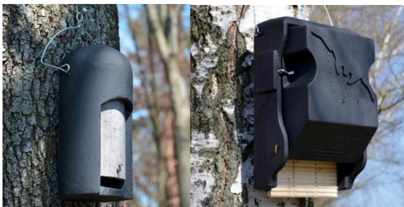
Abb. 4 Links: Fledermaushöhle 2FN (speziell)/ Rechts: Fledermaus-Großraum-Flachkasten 3FF

Die Kästen sind einmal jährlich zu reinigen und auf Funktionsfähigkeit zu prüfen. In diesem Rahmen erfolgt auch eine Reinigung (Entfernen von Vogel- und anderen alten Nestern). Defekte Kästen sind zu reparieren oder zu ersetzen. Eine Wirksamkeit wird innerhalb von im Allgemeinen 1-5 Jahren angenommen.