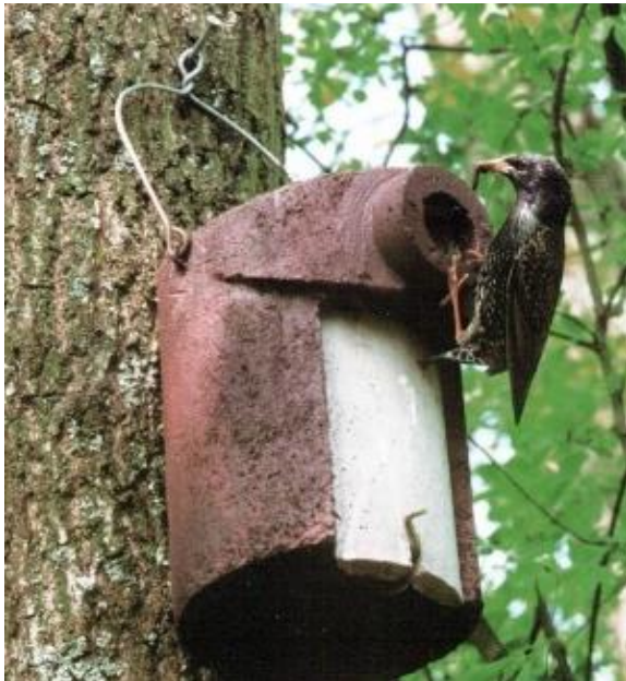
Abb. 5 Beispiel Nisthilfe: Nistkasten Schwegler 3SV mit einer Fluglochweite von 45 mm und Katzen- und Marderschutz