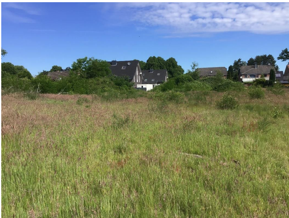
Die Fläche westlich des aufgegebenen Sportplatzes weist in den Randbereichen dichtes Brombeergebüsch sowie Aufwuchs von Baumgehölzen auf.