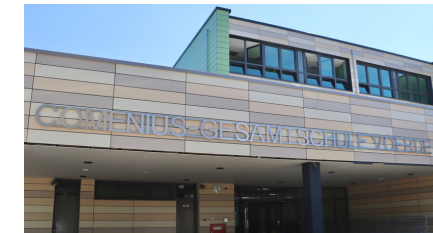
Comenius-Gesamtschule Voerde (NTP 1) Allee 1, 46562 Voerde