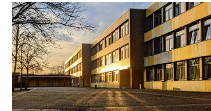
Gymnasium Voerde (NTP 2) Am Hallenbad 33, 46562 Voerde